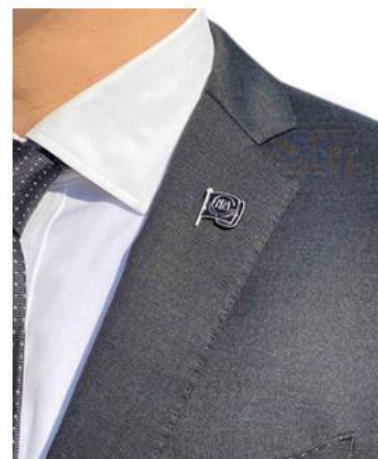
専門士バッジを装着したイメージ