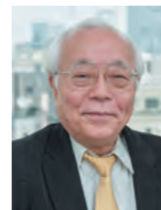
学長 竹村公太郎氏 (日本水フォーラム代表理事)

2020年4月から2021年3月まで 60講座が受け放題! 単位取得で嬉しい特典も!